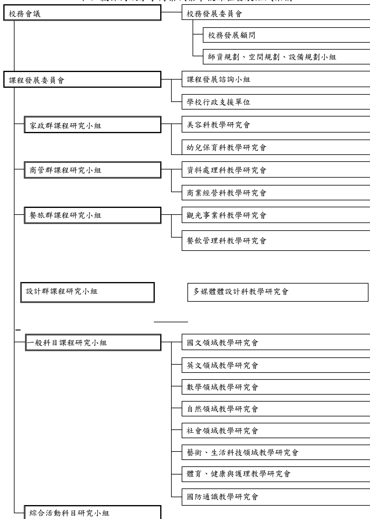
圖 1 課程發展組織架構圖