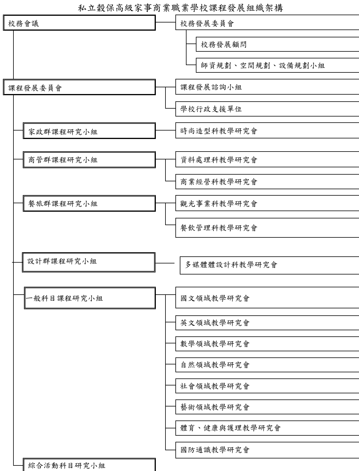
圖 1 課程發展組織架構圖